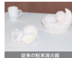
従来の粉末消火器

従来の粉末消火器は、部屋中に粉が飛散しますが、キッチンアイは薬剤を拭き取るだけで、後片付けが簡単です。